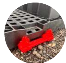
Rigole Unterseite Einzelverbinder

Die Aquabox ist ein LKW-befahrbares, spülbares sowie inspezierbares Regenwasserversickerungssystem.