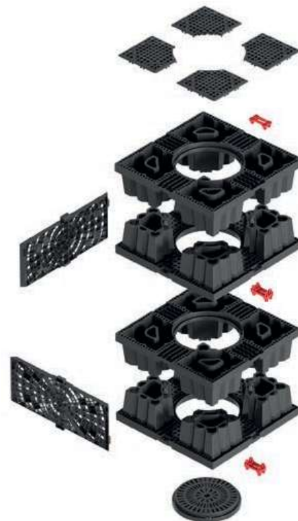
Effektive Aquabox Cube Bauhöhe H=400 mm pro Lage