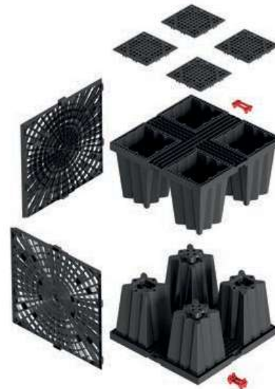
Effektive Aquabox Bauhöhe H=800 mm pro Lage