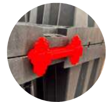
Rigole mit zwei oder mehr Lagen Doppelverbinder