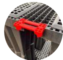
Rigole Oberseite Einzelverbinder